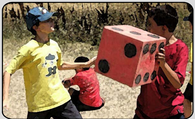
30. IL TORNEO