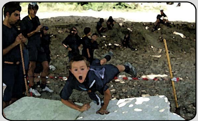
28. IL SALTO IN ALTO