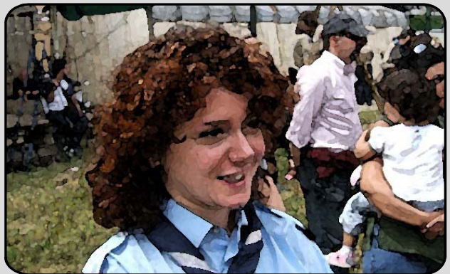
36. LA CAPO FUOCO