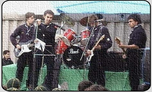
34. LA BANDA