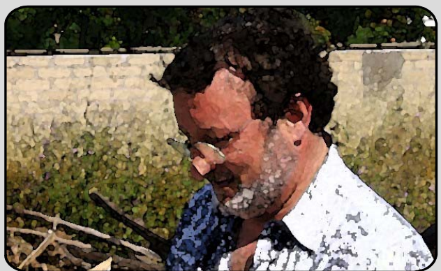
32. IL TUTTOFARE