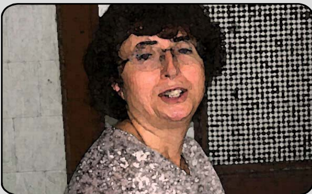
37. LA KAMBUSIERA