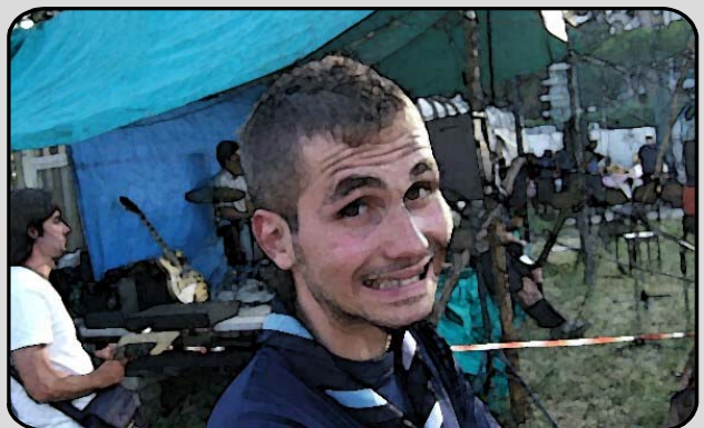
38. IL CAPO BRANCO