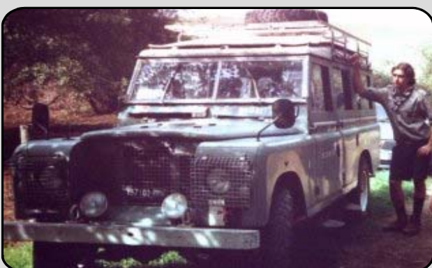
39. LA LAND ROVER