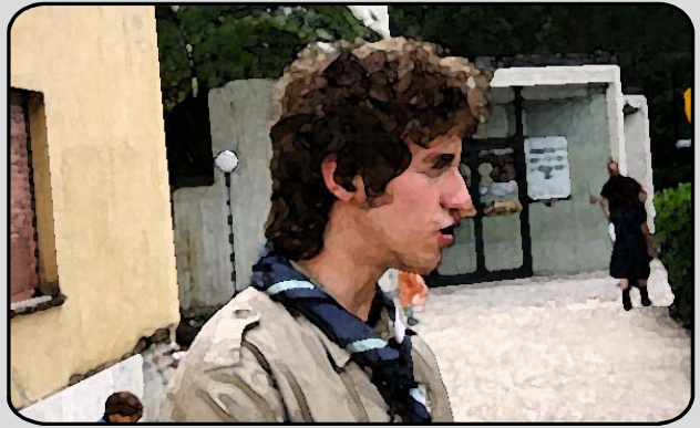
26. IL MUSICISTA