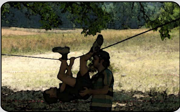
27. IL PASSAGGIO ALLA MARINARA