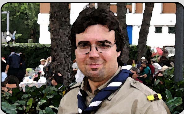
29. IL TECNICO