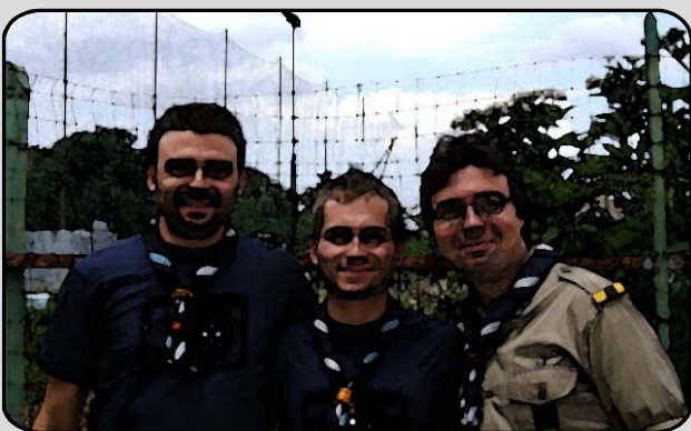
31. IL TRIO